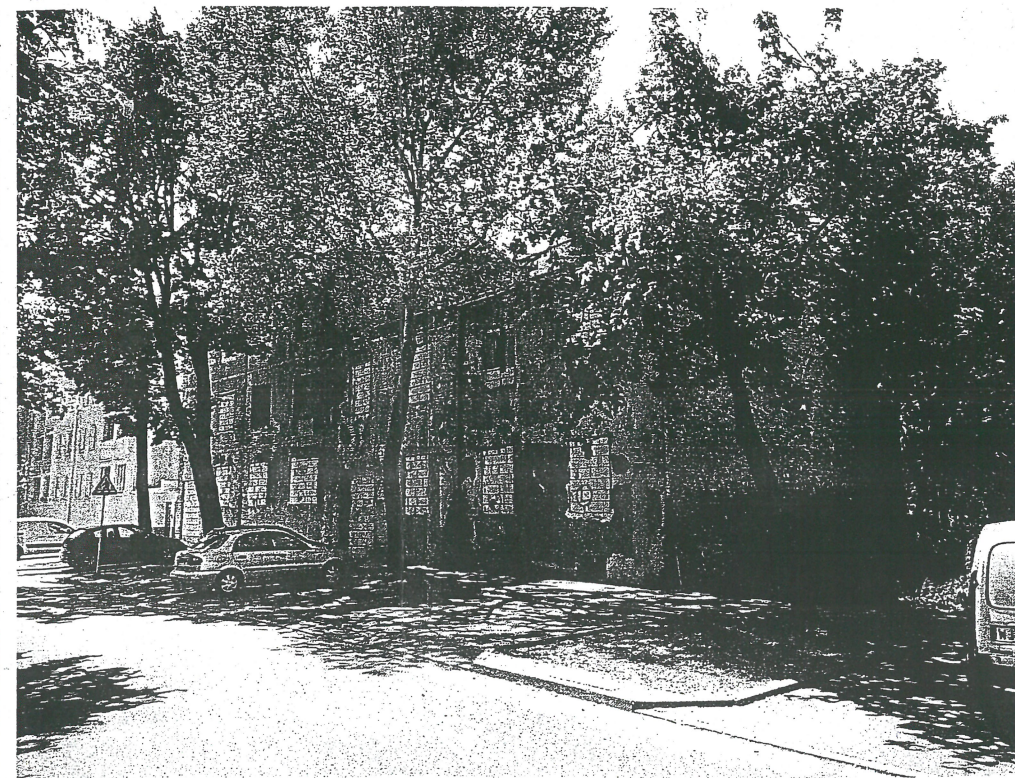
Fot. 2 Budynki mieszkalne przy ul. Korzonna 93 i 95 (od lewej).